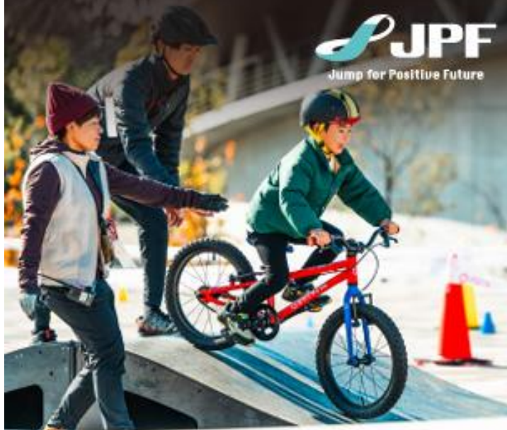
公営競技場トータルマネジメント