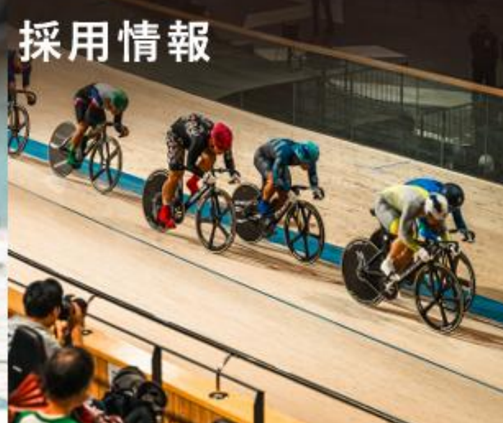
千葉 JPF ドーム